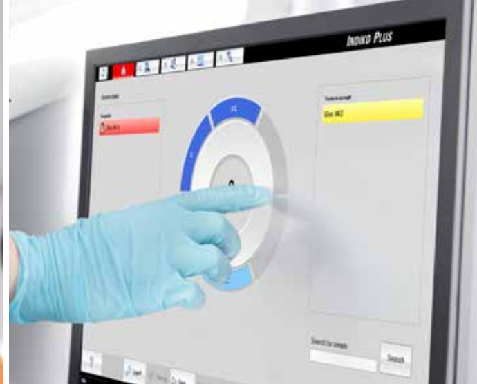
Sclavo Indiko Plus Sistema per Chimica Clinica e Test Speciali